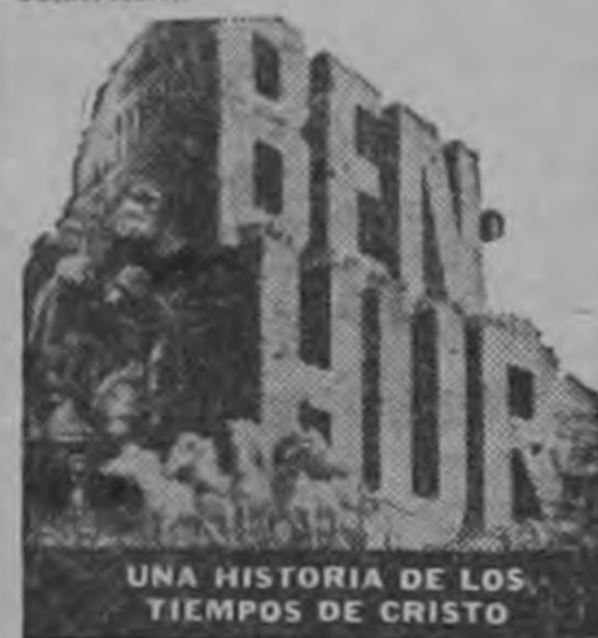
UNA HISTORIA DE LOS TIEMPOS DE CRISTO

VARIEDADES 2 y 7 ..... $ 5.00 Charlton Heston Haya Hurareet, Stephen Boyd, Jack Hawkins